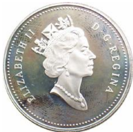
Fig. 70 CANADA 1 Dollaro 1995 al D/ effigie della Regina Elisabetta II al R/ effigi di Médard Chouart (Sieur di Groseilliers) e di Pierre-Esprit Radisson, sullo sfondo la nave "Nonsuch" che servi- va per il trasporto dei commercianti da una riva all'altra della baia di Hudson argento gr. 25,175 - titolo 925‰ condizione Fondo Specchio 259Rif. Cat. KM

Le due società si fusero nel 1821; la nuova Compagnia ebbe così il monopolio del commercio nei paesi compresi fra le terre del