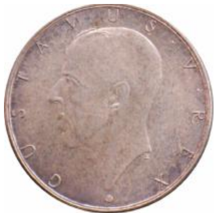
Fig. 68 SVEZIA 2 Kronor 1938 al D/ effigie verso sinistra di Gustavo V al R/ veliero del XVII secolo 300° anniversario dell'insediamento nel Delaware chiamato inizialmente "Nueva Suecia" argento gr. 15 - titolo 800‰ pezzi conati 508.815 Rif. Cat. KM 807

Poco dopo la scoperta del Delaware, avvenuta nel 1609 ad opera di Hudson, risalgono le prime colonie europee della zona, appartenenti agli Olandesi (1621) e agli Svedesi (1638), che ben presto entrarono in lotta con gli Anglosassoni della Virginia.