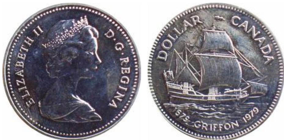
Fig. 71 CANADA veliero del XVII secolo 1 Dollaro 1979 al D/ effigie della Regina Elisabetta II al R/ rappresentazione del veliero "Griffon" argento gr. 23,3276 - titolo 500‰ pezzi conati 826.695 Rif. Cat. KM 124

Nel 1679 viene organizzata per la prima volta, una spedizione nei Grandi Laghi con un veliero commerciale, il Griffon.