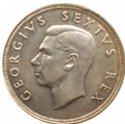
Fig. 69 SUD AFRICA 5 Shillings 1952 al D/ effigie verso sinistra di Giorgio VI al R/ veliero del XVII secolo che Approda nella Baia della Tavola argento gr 28,28 - titolo 500‰ pezzi conati 1.698mila Rif. Cat. KM 41

La Compagnia Olandese delle Indie Orientali, nel 1652, mise Van Riebeeck a capo di una spedizione, destinata a creare una prima base stabile nella regione del Capo di Buona Speranza; sbarcato nella baia della Tavola, egli vi fondò la fortezza "de Goede Hoop", intorno alla quale si costituì il primo nucleo di Città del Capo.