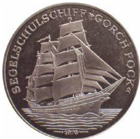
Fig. 66 GERMANIA al D/ nave scuola "Gorch Fock" al R/ marinaio con la scritta: "SEEFART IST NOT" medaglia anno 1976 Metallo nickel condizione Fondo Specchio peso gr. 18