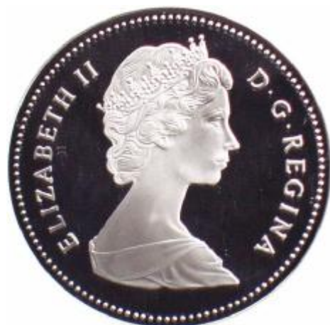
Fig. 67 CANADA 1 Dollaro 1987 al D/ effigie della Regina Elisabetta II verso destra al R/ la nave di John Davis in mezzo ai ghiacci argento gr. 23,2376 - titolo 500‰ pezzi conati 602.374 Rif. Cat. KM 154

Molteplici sono gli avvenimenti che hanno fatto Storia tramite i velieri; ne citiamo alcuni che, tra l'altro, sono stati commemorati sia con monete che con medaglie.