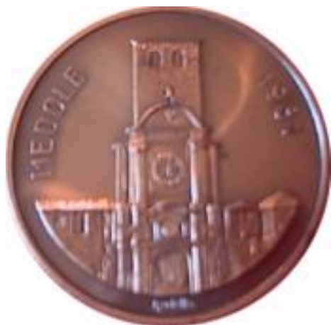
D/ La torre del castello medolese R/ Il Cristo che appare alla Madre

La pala continua ad essere al suo posto d'onore da oltre quattro secoli e domina, dietro l'Altar Maggiore, la bella chiesa di Medole.