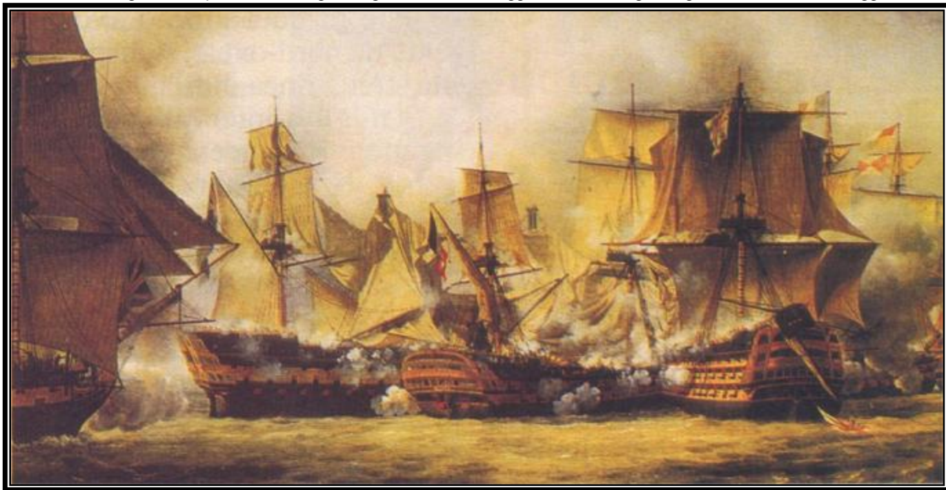
Fig. 73 - battaglia di Trafalgar (un vascello francese è incalzato da due navi inglesi) - di Louis Philip Crépin

La nave ammiraglia Victory di Nelson (fig. 72), gravemente danneggiata nella battaglia (fig. 73), fu restaurata e oggi si trova in