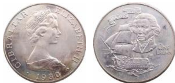
Fig. 72 GIBILTERRA 1 Crown 1980 al D/ effigie della Regina Elisabetta II al R/ l'ammiraglio Nelson e, sullo sfondo, la "Victory" cupro-nickel - diametro mm 38 pezzi conati 100.000 Rif. Cat. KM 12

La sconfitta della flotta franco-ispagnola costrinse Napoleone a rinunciare definitivamente all'invasione dell'isola britannica