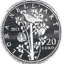
Flora e Fauna nell'Arte