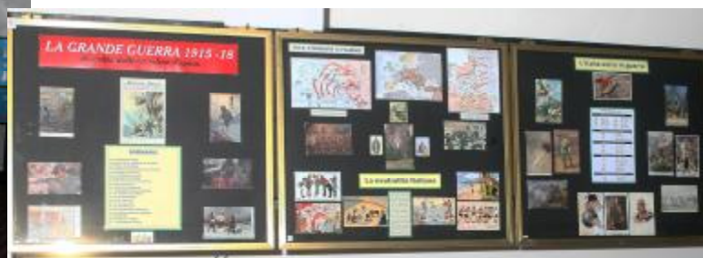
Particolare della mostra di Cartoline sulle Truppe Alpine