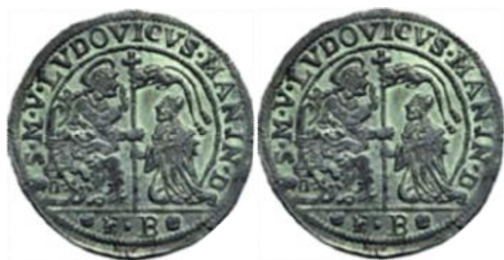
L'ultimo ducato d'argento veneziano (Doge Ludovico Manin - 1789-1797)