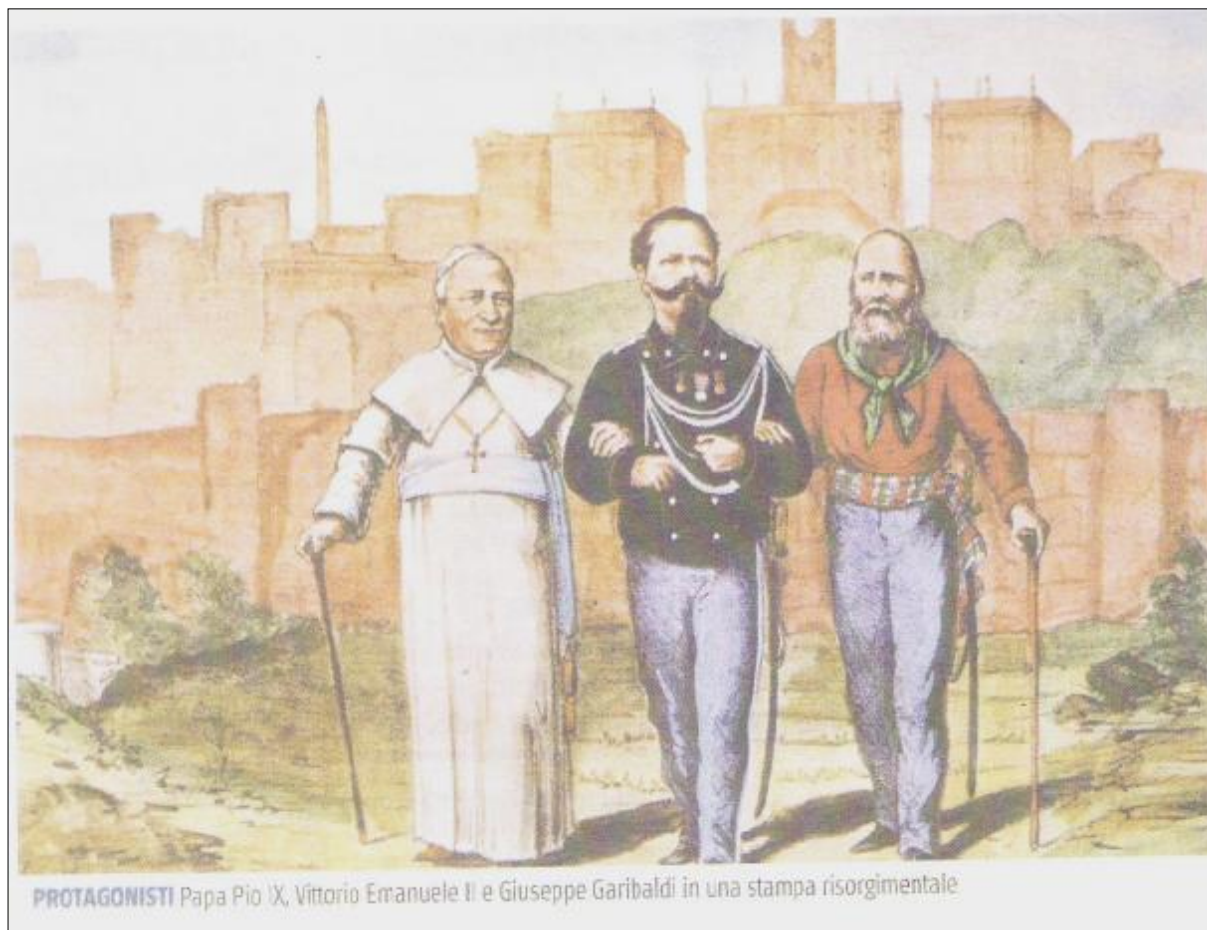
PROTAGONISTI Papa Pio IX, Vittorio Emanuele II e Giuseppe Garibaldi in una stampa risorgimentale