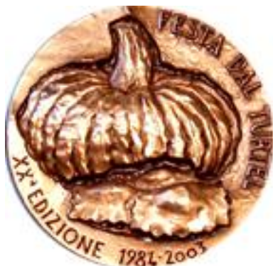
Festa dal turtel (festa del tortello di zucca)