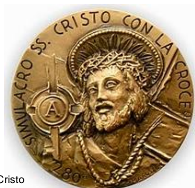
Simulacro SS. Cristo