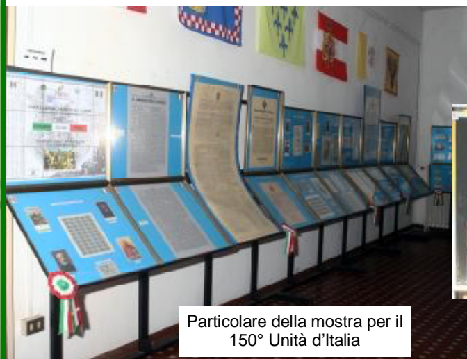
Particolare della mostra per il 150° Unità d'Italia