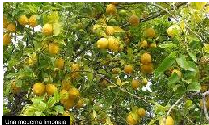
Una moderna limonaia