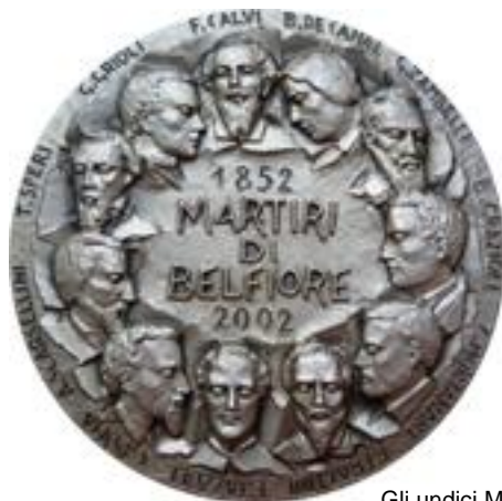
Gli undici Martiri di Belfiore