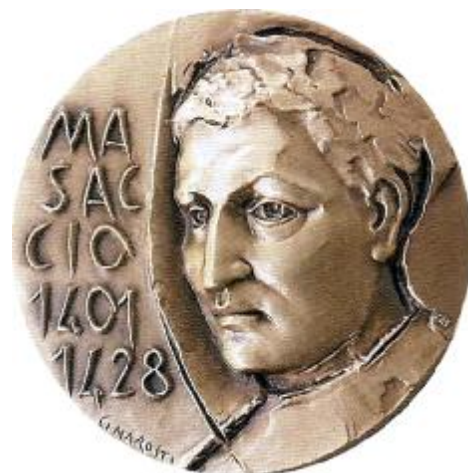
Masaccio: un genio del rinascimento