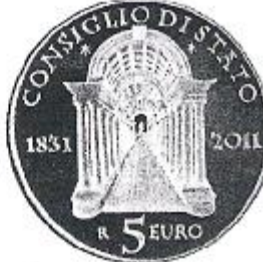
Consiglio di Stato