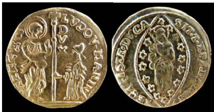
L'ultimo zecchino o ducato d'oro veneziano (Doge Ludovico Manin - 1789-1797)

Realizzato in lega di metallo bianca, dorato antico in bagno galvanico a 24 kt dalla ditta BMN Arte di Verona.