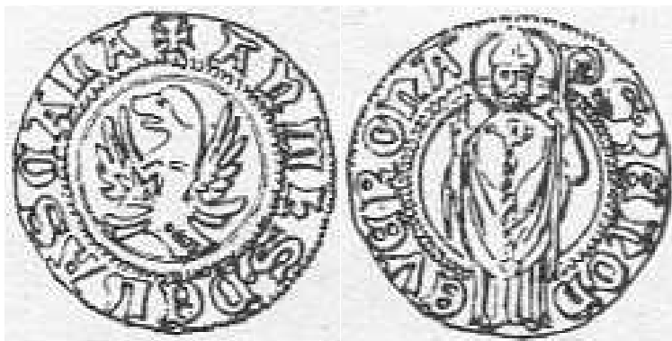
Grosso di Antonio Della Scala, signore di Verona - 1381-1387

Realizzato in lega di metallo bianca, argentata antica a titolo 1.000.