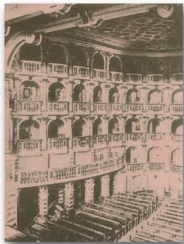
Il Teatro Bibiena di Mantova che accolse Mozart, giovane genio della musica.